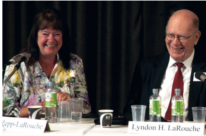
La dirigente alemana Helga Zepp-LaRouche junto con su esposo Lyndon H. LaRouche.

No es sólo el asesinato extrajudicial de Gadafi lo que refleja la locura criminal estilo Nerón de Obama, dijo LaRouche. También están los asesina- Pasa a la página 4