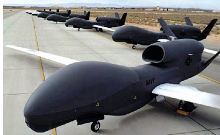
Un vehículo aéreo no tripulado de EU.

Este servicio noticioso, EIRNS, se ha enterado que la noticia publicada por Reuters