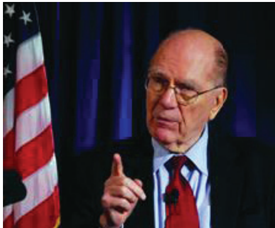
Lyndon H. LaRouche.

Luego tienes que mirar el otro lado de esto: si miras desde, digamos, 500 millones años atrás, por ejemplo, hasta el momento actual, y examinas la historia de los procesos vivientes, verás que la historia es que el orden de los procesos vivientes —que van sustituyéndose unos a otros en este gran tren—va en términos de densidades de flujo energético más altas . En otras palabras, niveles más elevados de concentración de energía. ¡Especies superiores! Las especies superiores en lo biológico reemplazan a las especies de orden inferior; ésa es la característica general de la destrucción de las especies.