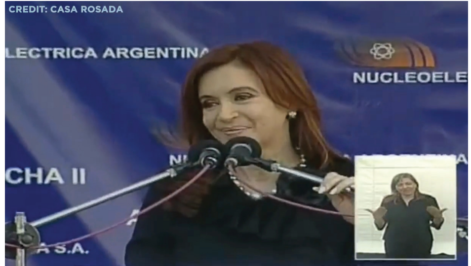
Cristina Fernández viuda de Kirchner, recién reelegida a la Presidencia de la Argentina.

Para los países en vías de desarrollo, el camino tomado por la presidenta argentina representa una alternativa a la extinción a manos del Imperio Británico; ofrece liderazgo en la batalla por sobrevivir, sumado a la “Gran Alianza del Pacífico” de Rusia, China