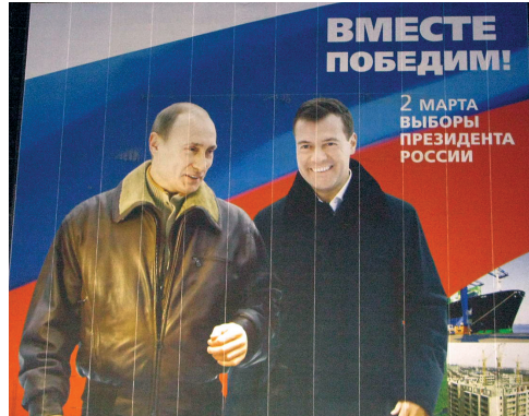
Putin y Medvédev: “Juntos ganaremos”.

La candidatura fue anunciada de una forma tal, que sirvió para demostrar que todas las fantasías occidentales sobre un