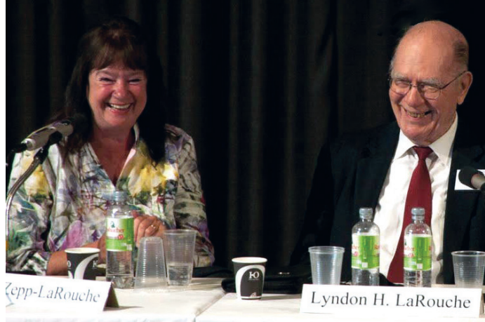
La dirigente alemana Helga Zepp-LaRouche junto con su esposo Lyndon H. LaRouche.