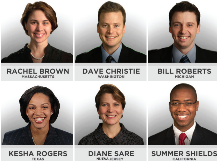
Los candidatos demócratas larouchistas al Congreso de EU.

“Como cuadros de un liderazgo joven en EU, los seis demócratas larouchistas están reclutando a otros para que se unan en pos de la única combinación programática que funcionará: sacar a Obama, reinstaurar la Glass-Steagall y comenzar a construir NAWAPA”.